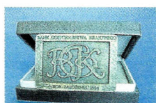
Medal Banku Gospodarstwa Krajowego 2004